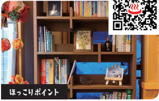
ほっこりポイント