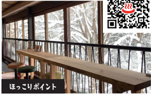
ほっこりポイント