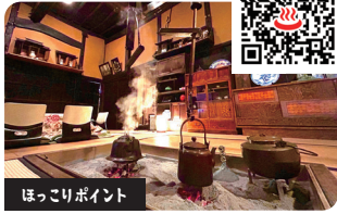
ほっこりポイント